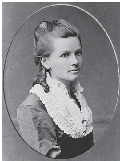
Photo der ca. 23-jährigen Bertha Benz (1849-1944)

Die authentische Fahrtroute der Bertha Benz verknüpft aber nicht nur fast vergessene Originalschauplätze ihrer Fahrt, sondern führt auch durch eine der schönsten Urlaubsregionen Deutschlands, das von der Sonne verwöhnte Wein- und Genießerland Baden. Dabei hat das Land Baden nicht nur die höchste Dichte an Restaurants mit